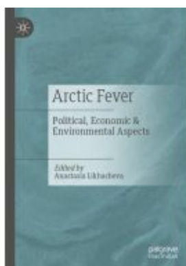
Arctic Fever Ladenpreis: 153,99EUR