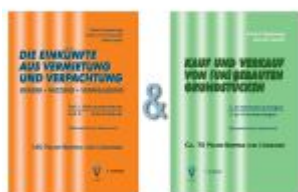
Set "Die Einkünfte aus Vermietung und Verpachtung" & "Kauf und Verkauf von (un)bebauten Grundstücken" Ladenpreis: 94,60EUR