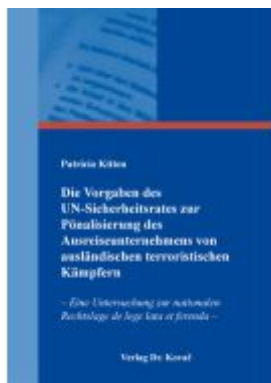
Die Vorgaben des UN-Sicherheitsrates zur Pönalisierung des Ausreiseunternehmens von ausländischen terroristischen Kämpfern Ladenpreis: 102,60EUR