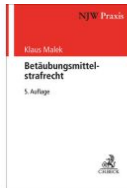
Betäubungsmittelstrafrecht Ladenpreis: 81,30EUR