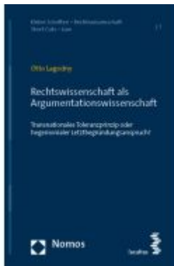
Rechtswissenschaft als Argumentationswissenschaft Ladenpreis: 29,90EUR

Wir haben andere Produkte gefunden, die Ihnen gefallen könnten!