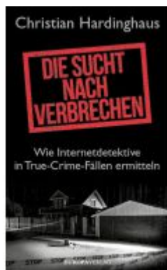
Die Sucht nach Verbrechen Ladenpreis: 22,70EUR