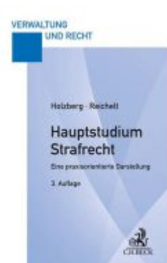
Hauptstudium Strafrecht Ladenpreis: 27,70EUR