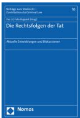
Die Rechtsfolgen der Tat Ladenpreis: 65,80EUR