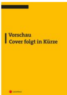
Datenschutzrecht kompakt Ladenpreis: 23,00EUR