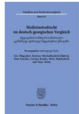
Medizinstrafrecht im deutsch-georgischen Vergleich. Ladenpreis: 113,00EUR