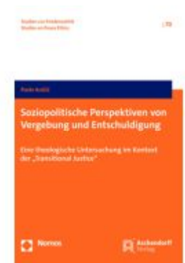
Soziopolitische Perspektiven von Vergabung und Entschuldigung Ladenpreis: 63,80EUR