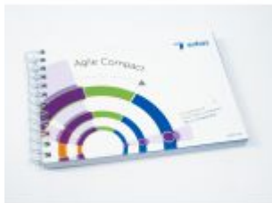
Agile Compact Ladenpreis: 14,95EUR