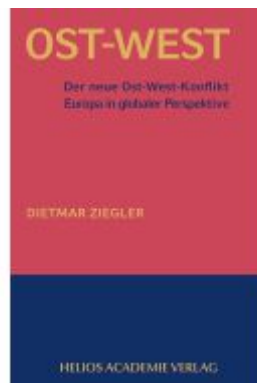
Der neue Ost-West Konflikt Ladenpreis: 15,30EUR