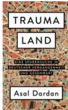
Traumaland Ladenpreis: 24,70EUR