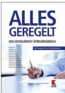
Alles geregelt. Das KONSUMENT-Vorsorgebuch Ladenpreis: 25,00EUR