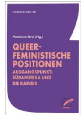
Queer-feministische Positionen Ladenpreis: 9,20EUR