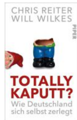
Totally kaputt? Ladenpreis: 24,70EUR