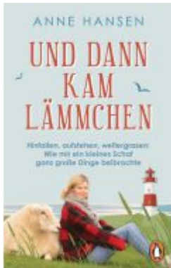
Und dann kam Lämmchen Ladenpreis: 13,40EUR