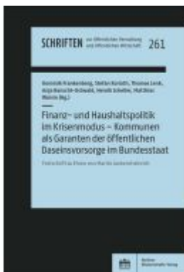
Finanz- und Haushaltspolitik im Krisenmodus – Kommunen als Garanten der öffentlichen Daseinsvorsorge im Bundesstaat Ladenpreis: 76,10EUR