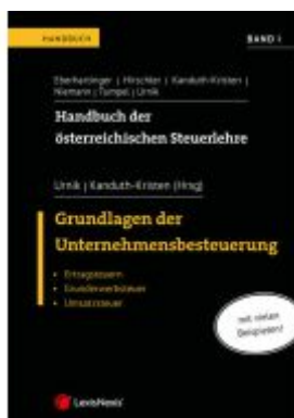
Handbuch der österreichischen Steuerlehre, Band I Ladenpreis: 85,00EUR