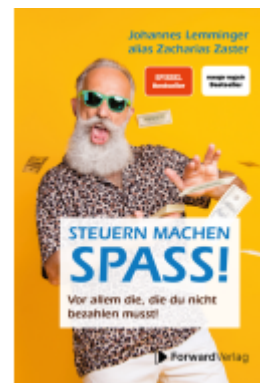
Steuern machen Spaß Ladenpreis: 24,90EUR