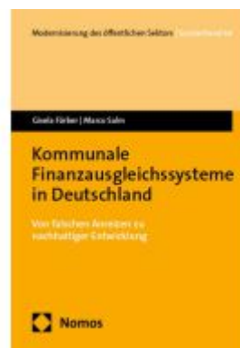
Kommunale Finanzausgleichssysteme in Deutschland Ladenpreis: 40,10EUR