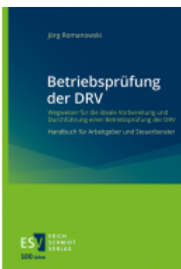
Betriebsprüfung der DRV Ladenpreis: 51,20EUR