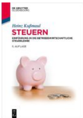
Steuern Ladenpreis: 34,95EUR