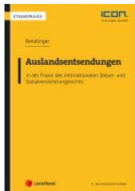
Auslandsentsendungen in der Praxis des internationalen Steuer- und Sozialversicherungsrechts Ladenpreis: 108,00EUR