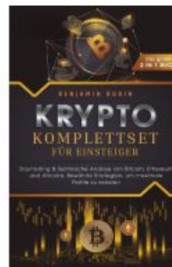
Krypto Komplettsset für Einsteiger - Das große 2 in 1 Buch: Daytrading & Technische Analyse von Bitcoin, Ethereum und Altcoins. Bewährte Strategien, um maximale Profite zu erzielen Ladenpreis: 36,00EUR