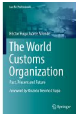
The World Customs Organization Ladenpreis: 71,49EUR