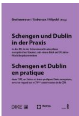
Schengen und Dublin in der Praxis, in der EU, in der Schweiz und in einzelnen europäischen Staaten mit einem Blick auf 70 Jahre Flüchtlingskonvention Ladenpreis: 107,00EUR