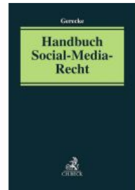
Handbuch Social-Media-Recht Ladenpreis: 112,10EUR