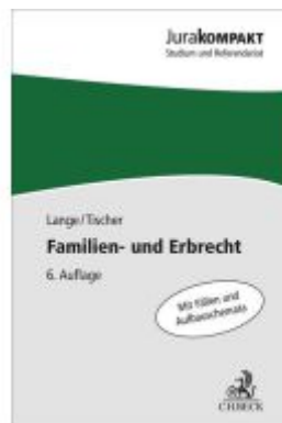
Familien- und Erbrecht Ladenpreis: 13,30EUR