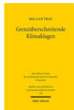
Grenzüberschreitende Klimaklagen Ladenpreis: 86,40EUR