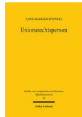
Unionsrechtsperson Ladenpreis: 96,70EUR