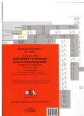
DürckheimRegister@ SARTORIUS, Gesetze und §§, OHNE Stichworte Ladenpreis: 18,50EUR