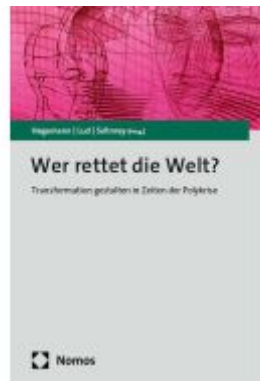
Wer rettet die Welt? Ladenpreis: 55,60EUR