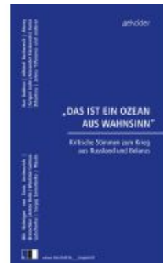
„DAS IST EIN OZEAN AUS WAHNSINN“ Ladenpreis: 15,50EUR