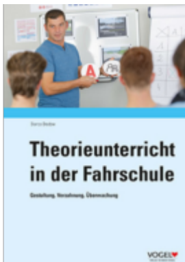
Theorieunterricht in der Fahrschule Ladenpreis: 45,70EUR