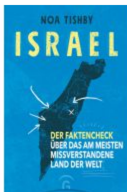
Israel Ladenpreis: 22,70EUR