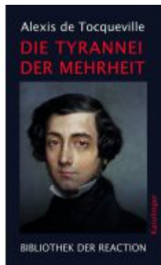
Die Tyrannei der Mehrheit Ladenpreis: 22,00EUR