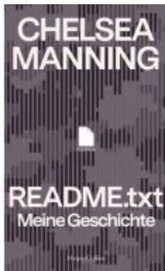
README.txt – Meine Geschichte Ladenpreis: 22,70EUR