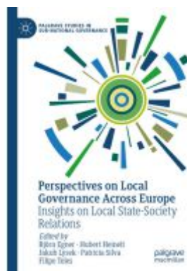
Perspectives on Local Governance Across Europe Ladenpreis: 142,99EUR