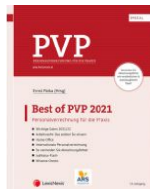
Best of PVP 2021 Ladenpreis: 60,00 EUR