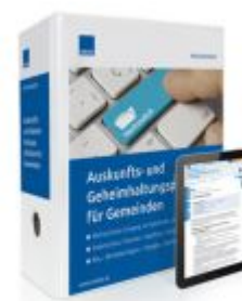
Auskunfts- und Geheimhaltungspflichten für Gemeinden Ladenpreis: 217,80 EUR