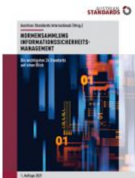
Normensammlung Informationssicherheitsmanagement Ladenpreis: 360,00 EUR