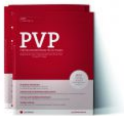
PVP Zeitschrift Ladenpreis: 0,00 EUR