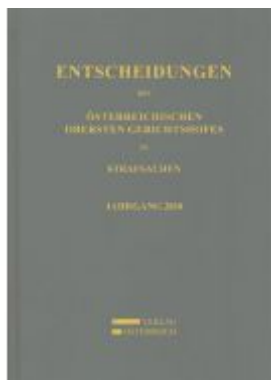
Entscheidungen des Österreichischen Obersten Gerichtshofes in Strafsachen Ladenpreis: 168,00 EUR