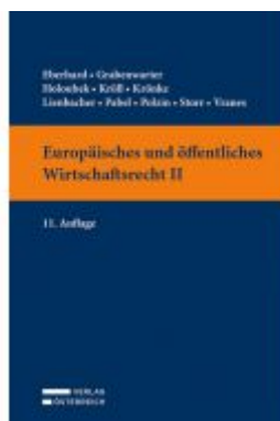
Europäisches und öffentliches Wirtschaftsrecht II Ladenpreis: 39,00 EUR