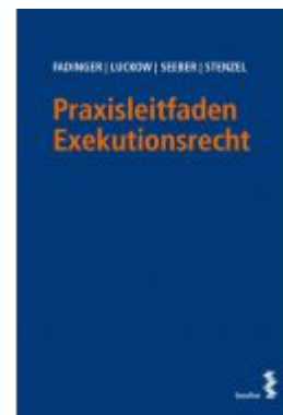
Praxisleitfaden Exekutionsrecht Ladenpreis: 42,00 EUR