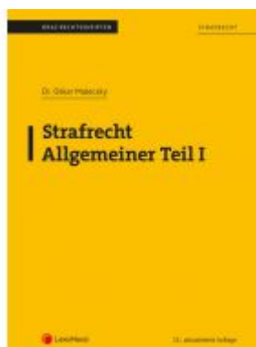
Strafrecht - Allgemeiner Teil I (Skriptum) Ladenpreis: 17,00 EUR