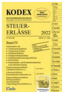
KODEX Steuer-Erlässe 2022, Band IV Ladenpreis: 63,00 EUR

Wir haben andere Produkte gefunden, die Ihnen gefallen könnten!