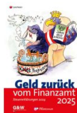
Geld zurück vom Finanzamt 2025 Ladenpreis: 23,90EUR