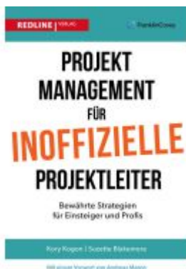
Projektmanagement für inoffizielle Projektleiter Ladenpreis: 20,60EUR