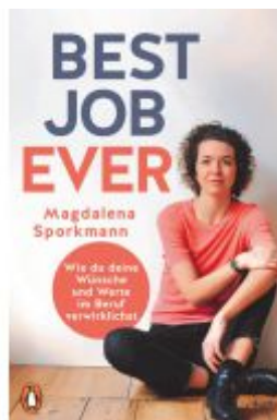
Best Job Ever Ladenpreis: 18,50EUR