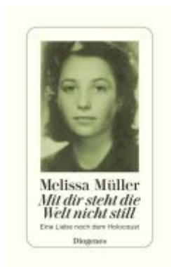
Mit dir steht die Welt nicht still Ladenpreis: 25,70EUR