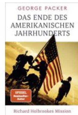
Das Ende des amerikanischen Jahrhunderts Ladenpreis: 35,00EUR