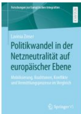
Politikwandel in der Netzneutralität auf europäischer Ebene Ladenpreis: 92,51EUR

Wir haben andere Produkte gefunden, die Ihnen gefallen könnten!