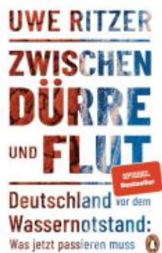
Zwischen Dürre und Flut Ladenpreis: 20,60EUR