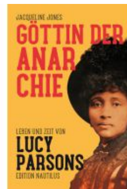
Göttin der Anarchie Ladenpreis: 35,00EUR