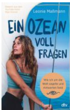
Ein Ozean voll Fragen Ladenpreis: 16,50EUR