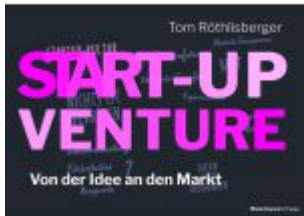
START-UP VENTURE Ladenpreis: 30,80EUR

Wir haben andere Produkte gefunden, die Ihnen gefallen könnten!