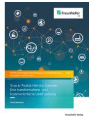
Smarte Produkt-Service Systeme: Eine transformations- und kostenorientierte Untersuchung Ladenpreis: 71,00EUR