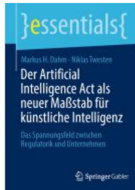
Der Artificial Intelligence Act als neuer Maßstab für künstliche Intelligenz Ladenpreis: 15,41EUR