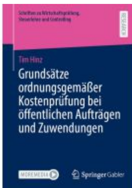
Grundsätze ordnungsgemäßer Kostenprüfung bei öffentlichen Aufträgen und Zuwendungen Ladenpreis: 77,09EUR