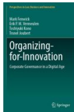
Organizing-for-Innovation Ladenpreis: 142,99EUR