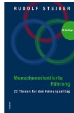
Menschenorientierte Führung Ladenpreis: 37,10EUR