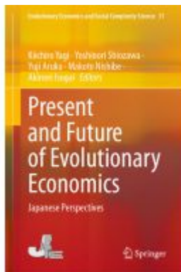
Present and Future of Evolutionary Economics Ladenpreis: 219,99EUR