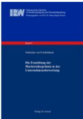
Die Ermittlung der Marktrisikoprämie in der Unternehmensbewertung Ladenpreis: 100,60EUR