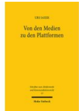
Von den Medien zu den Plattformen Ladenpreis: 60,70EUR