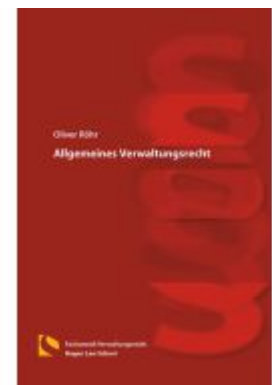
Allgemeines Verwaltungsrecht Ladenpreis: 40,10EUR