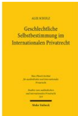
Geschlechtliche Selbstbestimmung im Internationalen Privatrecht Ladenpreis: 86,40EUR