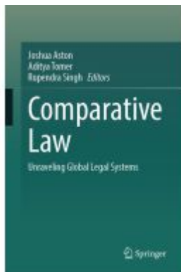
Comparative Law Ladenpreis: 186,99EUR