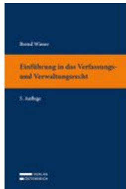
Einführung in das Verfassungs- und Verwaltungsrecht Ladenpreis: 39,00EUR