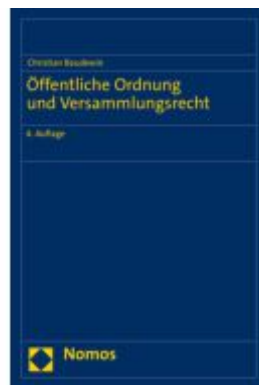
Öffentliche Ordnung und Versammlungsrecht Ladenpreis: 101,80EUR