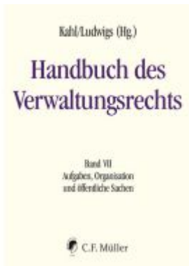
Handbuch des Verwaltungsrechts Ladenpreis: 287,90EUR