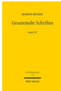
Gesammelte Schriften Ladenpreis: 71,00EUR