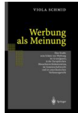
Werbung als Meinung Ladenpreis: 142,90EUR