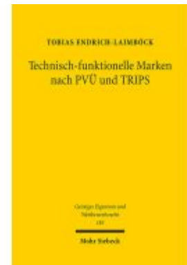
Technisch-funktionelle Marken nach PVÜ und TRIPS Ladenpreis: 91,50EUR