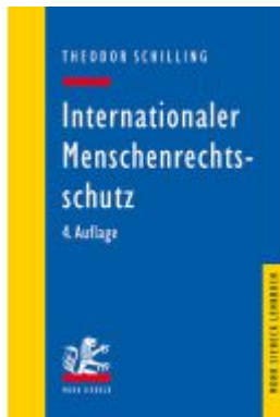
Internationaler Menschenrechtsschutz Ladenpreis: 40,10EUR

Wir haben andere Produkte gefunden, die Ihnen gefallen könnten!