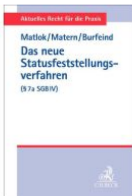
Das neue Statusfeststellungsverfahren (§ 7a SGB IV) Ladenpreis: 40,10EUR