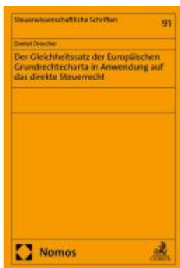
Der Gleichheitssatz der Europäischen Grundrechtecharta in Anwendung auf das direkte Steuerrecht Ladenpreis: 142,90EUR