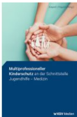
Multiprofessioneller Kinderschutz an der Schnittstelle Jugendhilfe - Medizin Ladenpreis: 19,60EUR