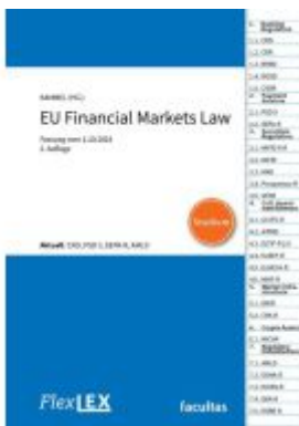
FlexLex EU Financial Markets Law | Studium Ladenpreis: 29,00EUR