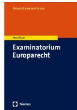
Examinatorium Europarecht Ladenpreis: 30,80EUR