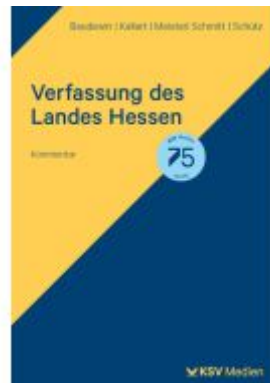
Verfassung des Landes Hessen Ladenpreis: 60,70EUR