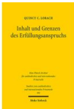
Inhalt und Grenzen des Erfüllungsanspruchs Ladenpreis: 86,40EUR

Wir haben andere Produkte gefunden, die Ihnen gefallen könnten!