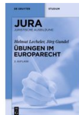
Übungen im Europarecht Ladenpreis: 19,95EUR