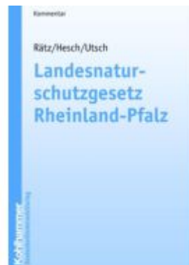
Landesnaturschutzgesetz Rheinland-Pfalz Ladenpreis: 36,00EUR