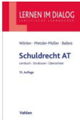
Schuldrecht AT Ladenpreis: 23,60EUR