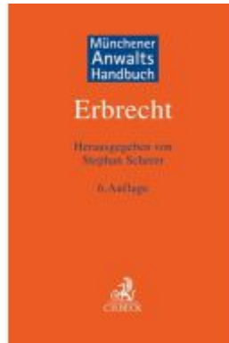
Münchener Anwalts Handbuch Erbrecht Ladenpreis: 225,20EUR