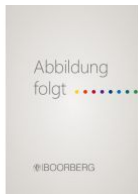
Das konventionswidrige Gesetz Ladenpreis: 49,40EUR