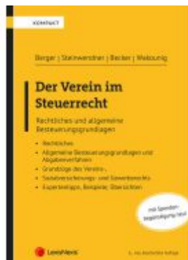
Der Verein im Steuerrecht Ladenpreis: 43,00EUR