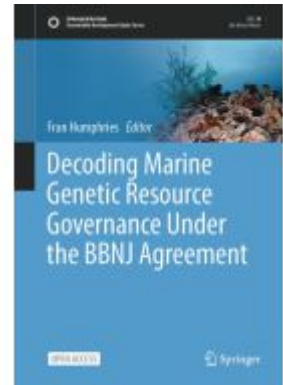
Decoding Marine Genetic Resource Governance Under the BBNJ Agreement Ladenpreis: 186,99EUR