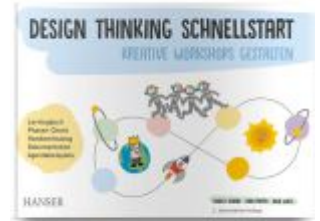
Design Thinking Schnellstart Ladenpreis: 25,70EUR