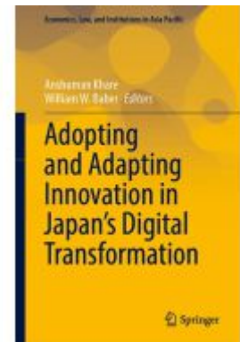
Adopting and Adapting Innovation in Japan's Digital Transformation Ladenpreis: 175,99EUR