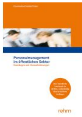
Personalmanagement im öffentlichen Sektor Ladenpreis: 32,90EUR