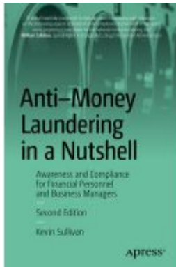
Anti-Money Laundering in a Nutshell Ladenpreis: 25,29EUR