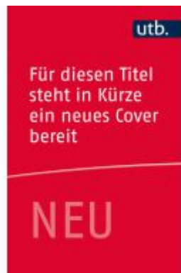
Nachhaltiges Personalmanagement Ladenpreis: 51,30EUR