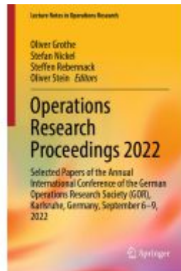
Operations Research Proceedings 2022 Ladenpreis: 241,99EUR