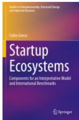
Startup Ecosystems Ladenpreis: 131,99EUR

Wir haben andere Produkte gefunden, die Ihnen gefallen könnten!