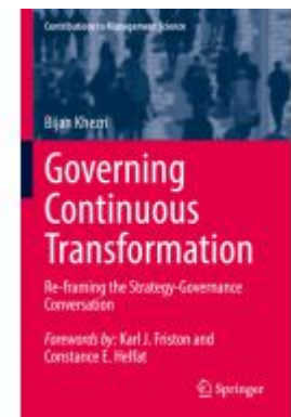
Governing Continuous Transformation Ladenpreis: 120,99EUR