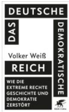
Das Deutsche Demokratische Reich Ladenpreis: 22,70EUR

Wir haben andere Produkte gefunden, die Ihnen gefallen könnten!