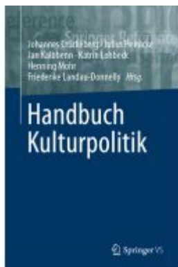
Handbuch Kulturpolitik Ladenpreis: 133,63EUR