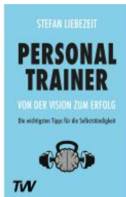
Personal Trainer: Von der Vision zum Erfolg Ladenpreis: 17,50EUR