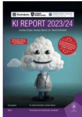
KI Report 2023/24 Ladenpreis: 32,90EUR