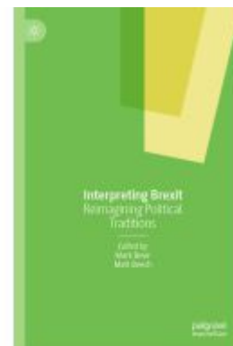
Interpreting Brexit Ladenpreis: 120,99EUR