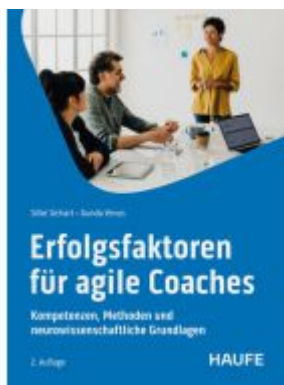
Erfolgsfaktoren für Agile Coaches Ladenpreis: 56,60EUR