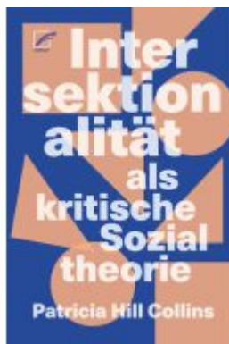
Intersektionalität als kritische Sozialtheorie Ladenpreis: 35,00EUR