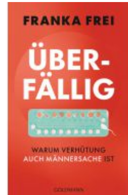
Überfällig Ladenpreis: 17,50EUR