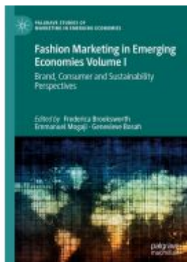
Fashion Marketing in Emerging Economies Volume I Ladenpreis: 175,99EUR