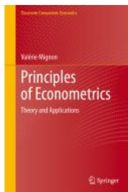
Principles of Econometrics Ladenpreis: 98,99EUR