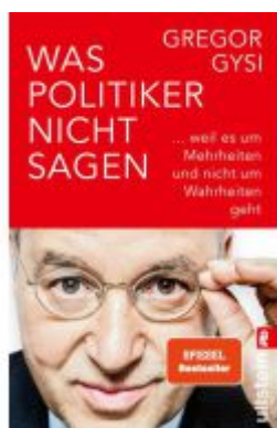
Was Politiker nicht sagen Ladenpreis: 14,40EUR