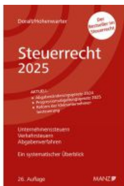
Steuerrecht 2025 Ladenpreis: 39,00EUR