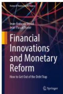
Financial Innovations and Monetary Reform Ladenpreis: 76,99EUR