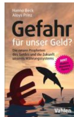
Gefahr für unser Geld? Ladenpreis: 20,40EUR