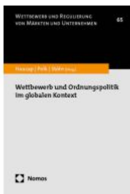
Wettbewerb und Ordnungspolitik im globalen Kontext Ladenpreis: 81,30EUR