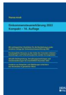
Einkommensteuererklärung 2022 Kompakt Ladenpreis: 51,30EUR