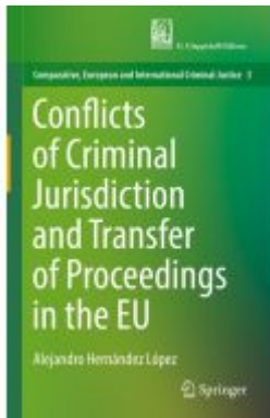
Conflicts of Criminal Jurisdiction and Transfer of Proceedings in the EU Ladenpreis: 153,99EUR