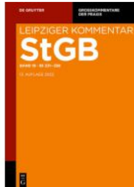
§§ 331-358 Ladenpreis: 179,00EUR