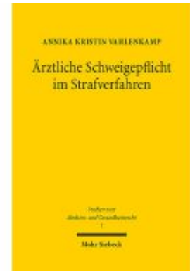
Ärztliche Schweigepflicht im Strafverfahren Ladenpreis: 91,50EUR