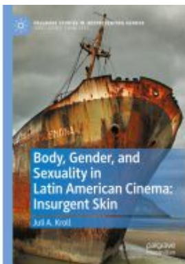
Body, Gender, and Sexuality in Latin American Cinema: Insurgent Skin Ladenpreis: 93,49EUR