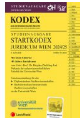
KODEX Startkodex Wien Juridicum 2024/25 - inkl. App Ladenpreis: 19,00EUR