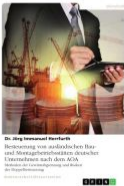
Besteuerung von ausländischen Bau- und Montagebetriebsstätten deutscher Unternehmen nach dem AOA Ladenpreis: 52,95EUR