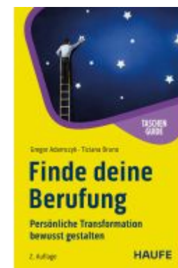
Finde deine Berufung! Ladenpreis: 12,40EUR