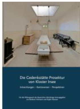
Die Gedenkstätte Prosektur von Kloster Irsee Ladenpreis: 18,30EUR