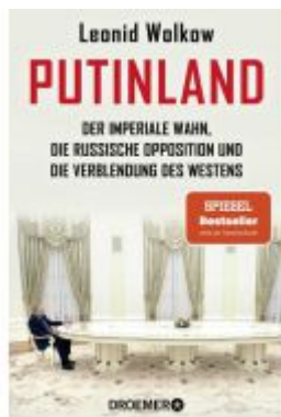
Putinland Ladenpreis: 14,40EUR

Wir haben andere Produkte gefunden, die Ihnen gefallen könnten!