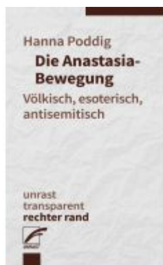
Die Anastasia-Bewegung Ladenpreis: 10,10EUR