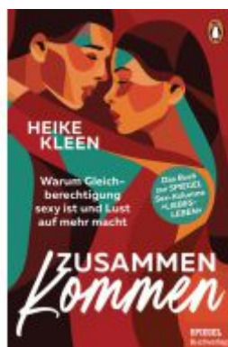
Zusammenkommen Ladenpreis: 16,50EUR