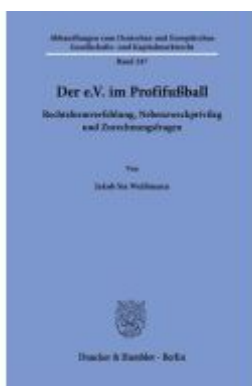
Der e.V. im Profifußball Ladenpreis: 71,90EUR