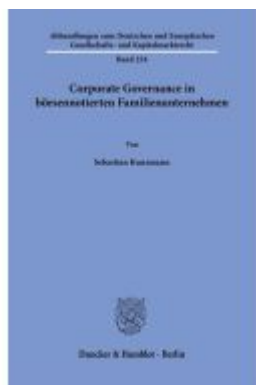
Corporate Governance in börsennotierten Familienunternehmen. Ladenpreis: 102,70EUR