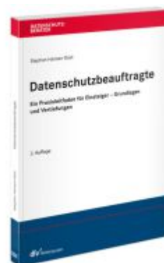
Datenschutzbeauftragte Ladenpreis: 60,70EUR