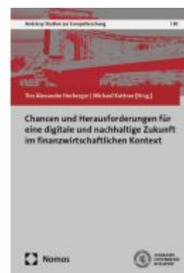
Chancen und Herausforderungen für eine digitale und nachhaltige Zukunft im finanzwirtschaftlichen Kontext Ladenpreis: 96,70EUR