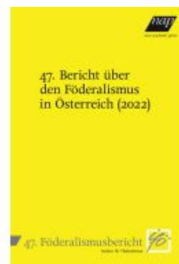
47. Bericht über den Föderalismus in Österreich (2022) Ladenpreis: 28,00EUR