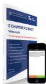
SCHWERPUNKT Völkerrecht Ladenpreis: 24,60EUR