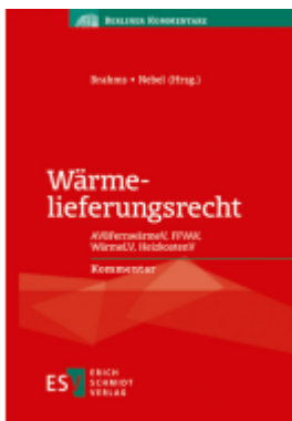
Wärmelieferungsrecht Ladenpreis: 102,80EUR

Wir haben andere Produkte gefunden, die Ihnen gefallen könnten!