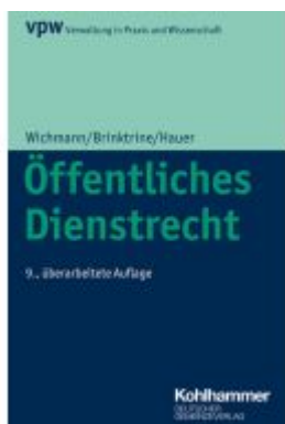
Öffentliches Dienstrecht Ladenpreis: 100,80EUR