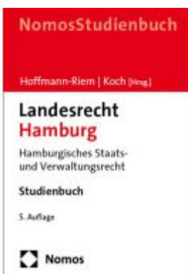
Landesrecht Hamburg Ladenpreis: 30,80EUR