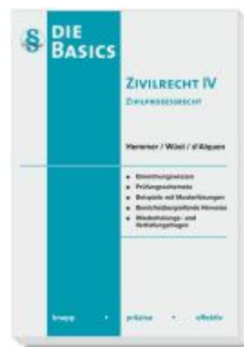
Basics - Zivilrecht IV Zivilprozessrecht (ZPO) Ladenpreis: 20,50EUR