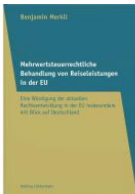
Mehrwertsteuerrechtliche Behandlung von Reiseleistungen in der EU Ladenpreis: 42,00EUR