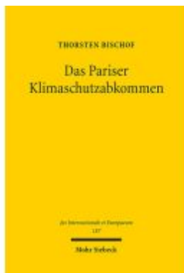
Das Pariser Klimaschutzabkommen Ladenpreis: 96,70EUR