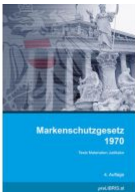
Markenschutzgesetz 1970 Ladenpreis: 26,00EUR