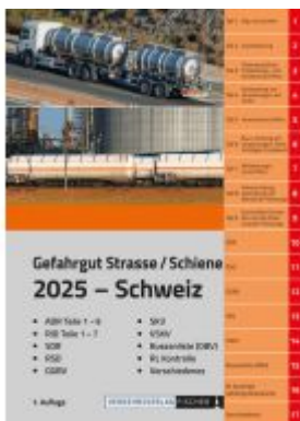
ADR/RID 2025 Schweiz Ladenpreis: 85,80EUR