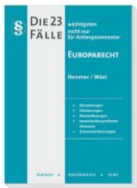
Die 23 wichtigsten Fälle Europarecht Ladenpreis: 16,40EUR