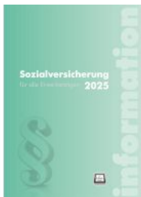
Sozialversicherung 2025 Ladenpreis: 54,00EUR