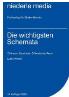
Die wichtigsten Schemata - 2023 Ladenpreis: 22,70EUR