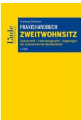
Praxishandbuch Zweitwohnsitz Ladenpreis: 49,00EUR