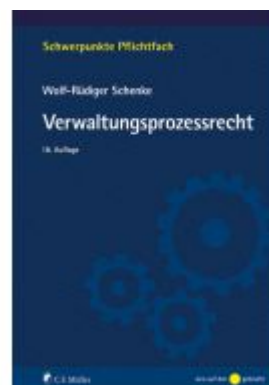
Verwaltungsprozessrecht Ladenpreis: 27,80EUR