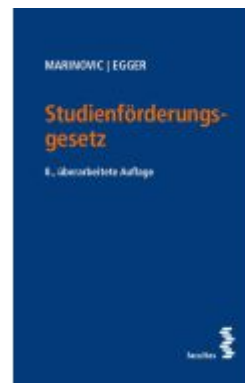
Studienförderungsgesetz Ladenpreis: 58,00EUR