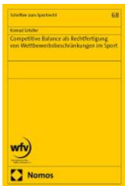
Competitive Balance als Rechtfertigung von Wettbewerbsbeschränkungen im Sport Ladenpreis: 122,40EUR