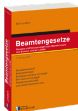
Beamtengesetze Ladenpreis: 56,50EUR