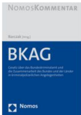
BKAG Ladenpreis: 184,10EUR