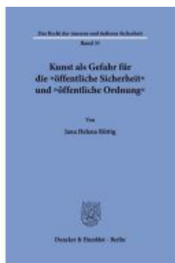
Kunst als Gefahr für die "öffentliche Sicherheit" und "öffentliche Ordnung" Ladenpreis: 102,70EUR