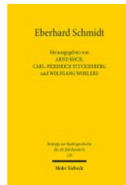
Eberhard Schmidt Ladenpreis: 101,80EUR