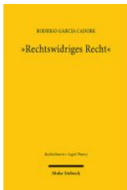
"Rechtswidriges Recht" Ladenpreis: 137,80EUR