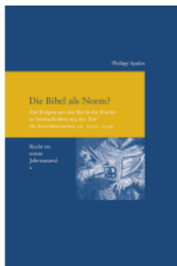
Die Bibel als Norm? Ladenpreis: 91,50EUR