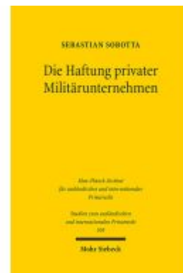
Die Haftung privater Militärunternehmen Ladenpreis: 81,30EUR