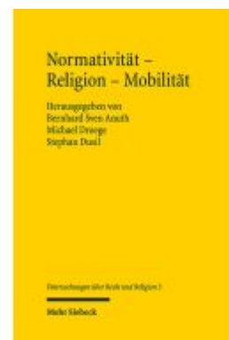
Normativität - Religion - Mobilität Ladenpreis: 76,10EUR