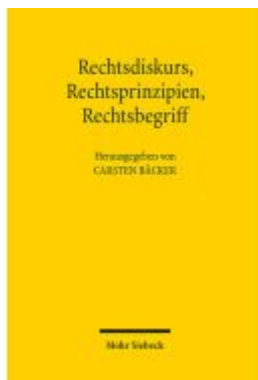
Rechtsdiskurs, Rechtsprinzipien, Rechtsbegriff Ladenpreis: 112,10EUR