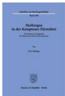
Herbergen in der Kemptener Fürstabtei. Ladenpreis: 143,90EUR