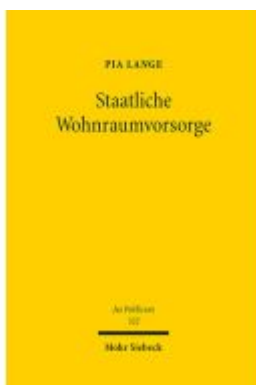
Staatliche Wohnraumvorsorge Ladenpreis: 127,50EUR