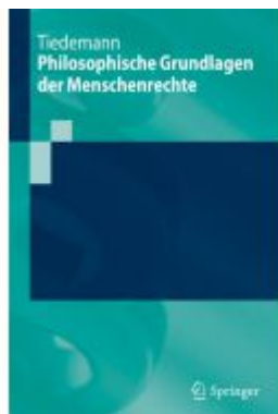
Philosophische Grundlagen der Menschenrechte Ladenpreis: 30,83EUR

Wir haben andere Produkte gefunden, die Ihnen gefallen könnten!