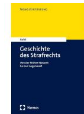
Geschichte des Strafrechts Ladenpreis: 30,80EUR