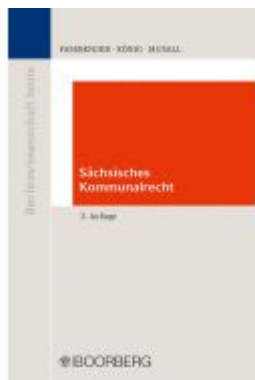
Sächsisches Kommunalrecht Ladenpreis: 49,40EUR