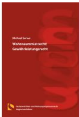
Wohnraummietrecht/Gewährleistungsrecht t Ladenpreis: 25,70EUR