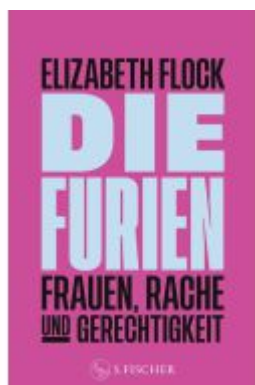
Die Furien – Frauen, Rache und Gerechtigkeit Ladenpreis: 28,80EUR