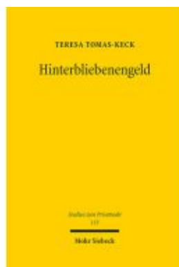
Hinterbliebenengeld Ladenpreis: 107,00EUR