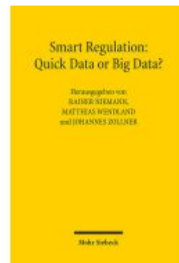
Smart Regulation: Quick Data or Big Data? Ladenpreis: 60,70EUR