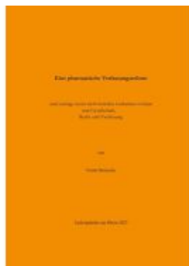
Eine phantastische Verfassungsreform Ladenpreis: 10,00EUR