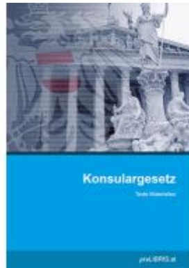
Konsulargesetz Ladenpreis: 23,00EUR