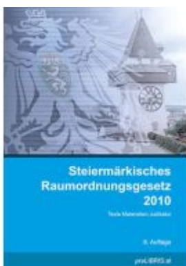
Steiermärkisches Raumordnungsgesetz 2010 Ladenpreis: 28,00EUR