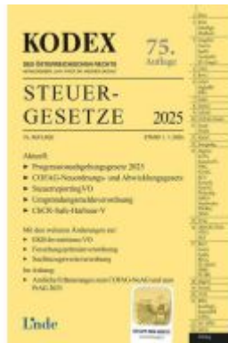
KODEX Steuergesetze 2025 Ladenpreis: 45,00EUR