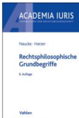
Rechtsphilosophische Grundbegriffe Ladenpreis: 20,60EUR