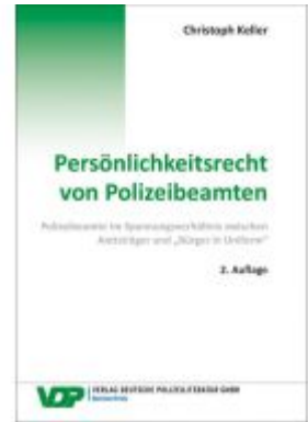
Persönlichkeitsrecht von Polizeibeamten Ladenpreis: 39,10EUR