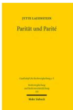
Parität und Parité Ladenpreis: 86,40EUR