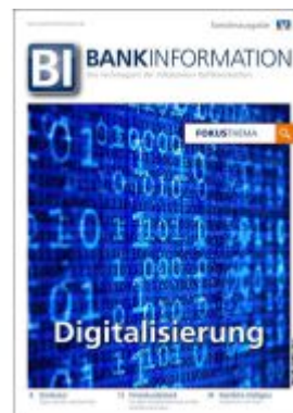
BankInformation, Fokus-Thema: Digitalisierung Ladenpreis: 12,90EUR