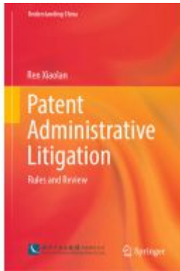
Patent Administrative Litigation Ladenpreis: 175,99EUR