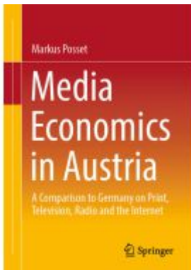
Media Economics in Austria Ladenpreis: 65,99EUR

Wir haben andere Produkte gefunden, die Ihnen gefallen könnten!