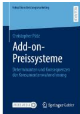
Add-on-Preissysteme Ladenpreis: 71,95EUR