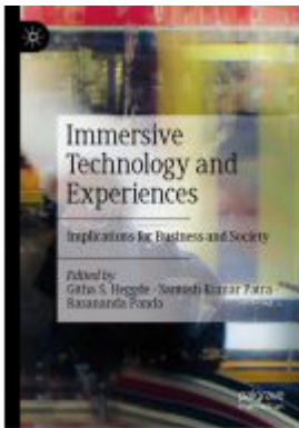
Immersive Technology and Experiences Ladenpreis: 153,99EUR