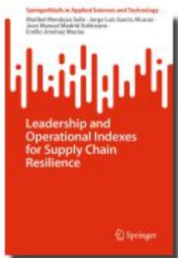
Leadership and Operational Indexes for Supply Chain Resilience Ladenpreis: 54,99EUR