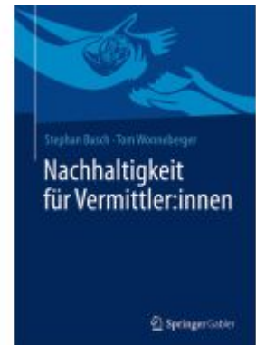
Nachhaltigkeit für Vermittler:innen Ladenpreis: 46,25EUR