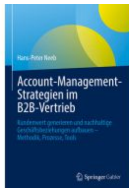
Account-Management-Strategien im B2B-Vertrieb Ladenpreis: 51,39EUR