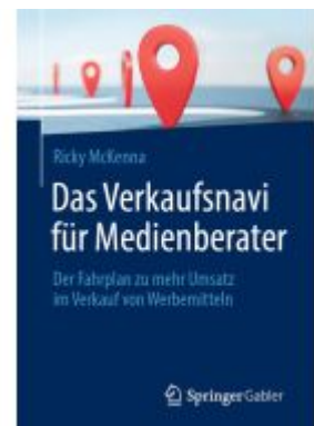
Das Verkaufsnavi für Medienberater Ladenpreis: 39,05EUR