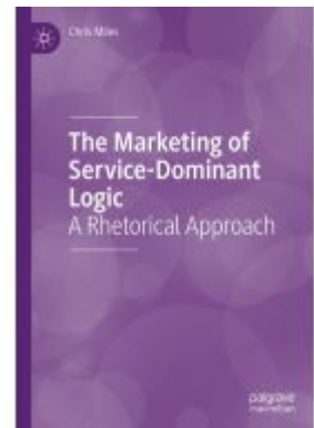
The Marketing of Service-Dominant Logic Ladenpreis: 153,99EUR