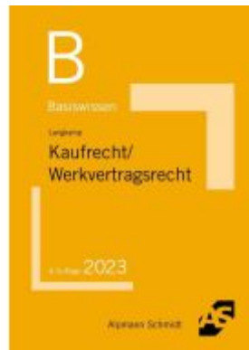
Basiswissen Kaufrecht / Werkvertragsrecht Ladenpreis: 13,30EUR