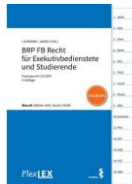
FlexLEX BRP FB Recht für Exekutivbedienstete und Studierende | Studium Ladenpreis: 15,00EUR