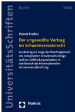
Der ungewollte Vertrag im Schadensersatzrecht Ladenpreis: 60,70EUR