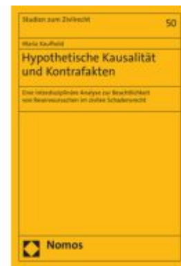
Hypothetische Kausalität und Kontrafakten Ladenpreis: 71,00EUR