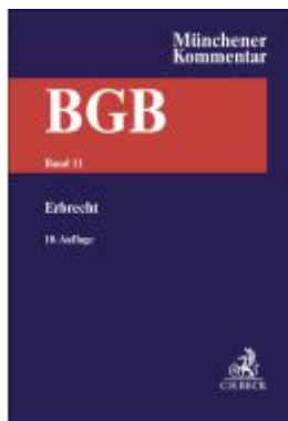
Münchener Kommentar zum Bürgerlichen Gesetzbuch Bd. 11: Erbrecht, §§ 1922-2385, §§ 27-35 BeurkG Ladenpreis: 328,00EUR