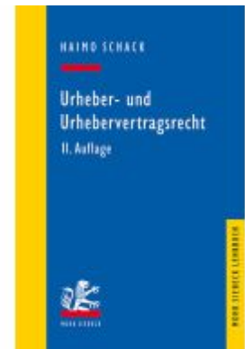
Urheber- und Urhebervertragsrecht Ladenpreis: 50,40EUR