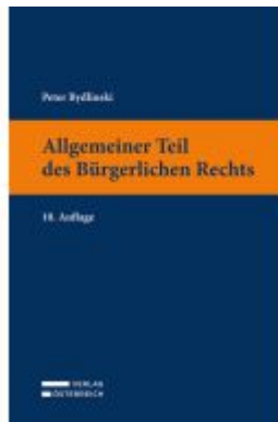
Allgemeiner Teil des Bürgerlichen Rechts Ladenpreis: 37,00EUR