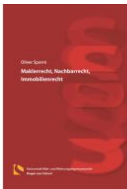
Maklerrecht, Nachbarrecht, Immobilienrecht Ladenpreis: 25,70EUR