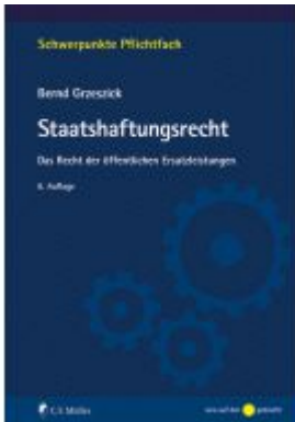
Staatshaftungsrecht Ladenpreis: 23,70EUR