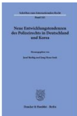
Neue Entwicklungstendenzen des Polizeirechts in Deutschland und Korea Ladenpreis: 82,20EUR