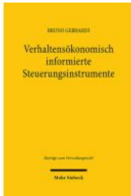
Verhaltensökonomisch informierte Steuerungsinstrumente Ladenpreis: 101,80EUR