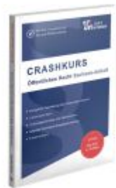
CRASHKURS Öffentliches Recht - Sachsen-Anhalt Ladenpreis: 26,70EUR

Wir haben andere Produkte gefunden, die Ihnen gefallen könnten!