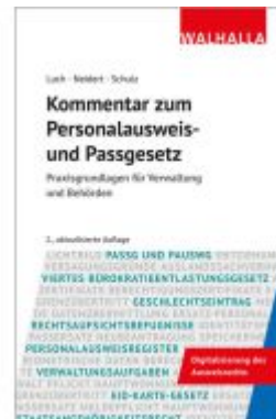
Kommentar zum Personalausweis- und Passgesetz Ladenpreis: 72,00EUR