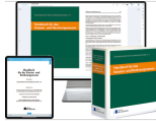
Handbuch für das Kassen- und Rechnungswesen – Print + Digital Ladenpreis: 196,40EUR