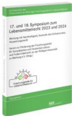
17. und 18. Symposium zum Lebensmittelrecht 2023 und 2024 Ladenpreis: 71,00EUR