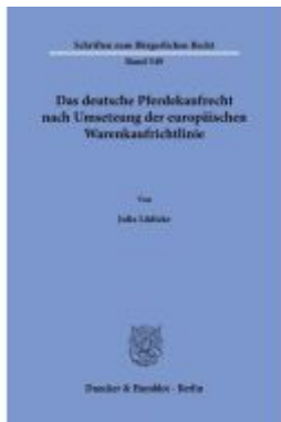
Das deutsche Pferdekaufrecht nach Umsetzung der europäischen Warenkaufrichtlinie. Ladenpreis: 71,90EUR