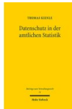
Datenschutz in der amtlichen Statistik Ladenpreis: 117,20EUR