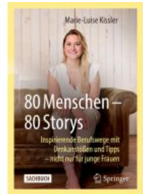
80 Menschen – 80 Storys Ladenpreis: 30,83EUR