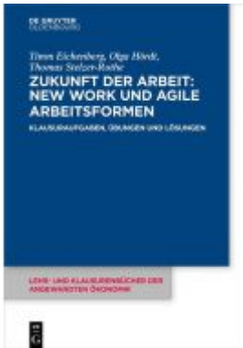
Zukunft der Arbeit: New Work und agile Arbeitsformen Ladenpreis: 24,95EUR