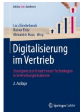
Digitalisierung im Vertrieb Ladenpreis: 77,09EUR