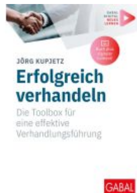
Erfolgreich verhandeln Ladenpreis: 33,90EUR