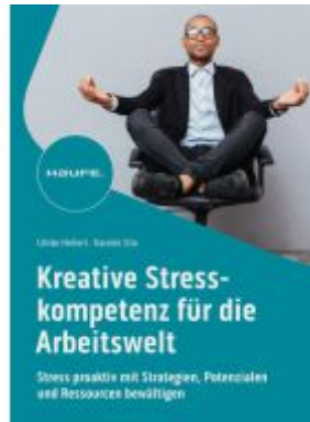
Kreative Stresskompetenz für die Arbeitswelt Ladenpreis: 51,40EUR