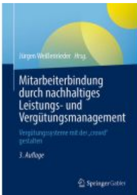
Mitarbeiterbindung durch nachhaltiges Leistungs- und Vergütungsmanagement Ladenpreis: 56,53EUR