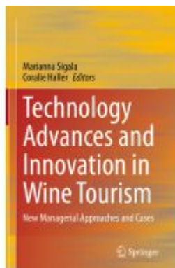
Technology Advances and Innovation in Wine Tourism Ladenpreis: 175,99EUR