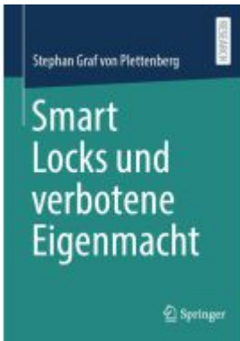
Smart Locks und verbotene Eigenmacht Ladenpreis: 102,79EUR