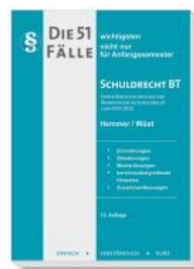
Die 51 Fälle Schuldrecht BT Ladenpreis: 16,40EUR