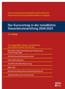
Der Kurzvortrag in der mündlichen Steuerberaterprüfung 2024/2025 Ladenpreis: 61,60EUR