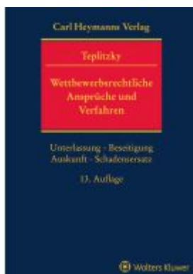
Wettbewerbsrechtliche Ansprüche und Verfahren Ladenpreis: 225,20EUR