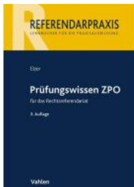
Prüfungswissen ZPO für das Rechtsreferendariat Ladenpreis: 41,00EUR

Wir haben andere Produkte gefunden, die Ihnen gefallen könnten!