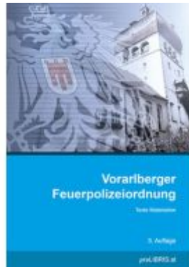
Vorarlberger Feuerpolizeiordnung Ladenpreis: 21,00EUR