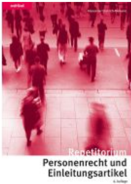
Repetitorium Personenrecht und Einleitungsartikel Ladenpreis: 65,80EUR