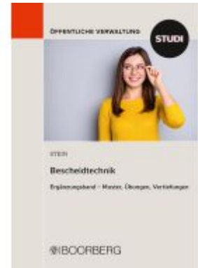
Bescheidtechnik Ladenpreis: 23,50EUR