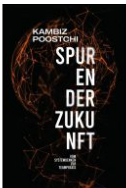
Spuren der Zukunft Ladenpreis: 35,00EUR