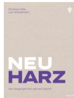
NeuHarz Ladenpreis: 40,10EUR