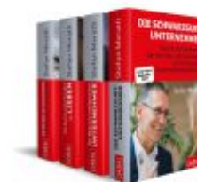
Unternehmertum mit Weitblick Ladenpreis: 123,40EUR