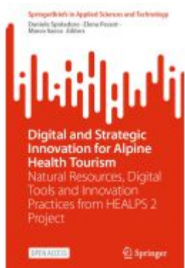
Digital and Strategic Innovation for Alpine Health Tourism Ladenpreis: 32,99EUR

Wir haben andere Produkte gefunden, die Ihnen gefallen könnten!