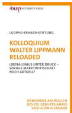
Kolloquium Walter Lippmann Reloaded Ladenpreis: 28,80EUR