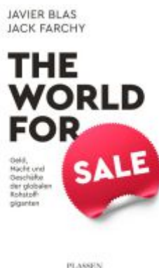
The World for Sale Ladenpreis: 30,70EUR