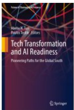
Tech Transformation and AI Readiness Ladenpreis: 109,99EUR