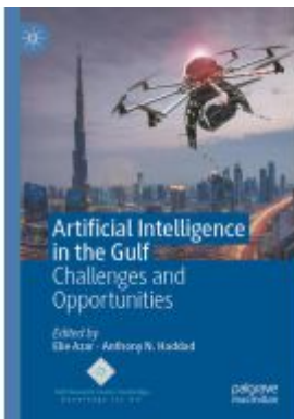
Artificial Intelligence in the Gulf Ladenpreis: 197,99EUR