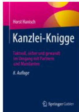
Kanzlei-Knigge Ladenpreis: 30,83EUR