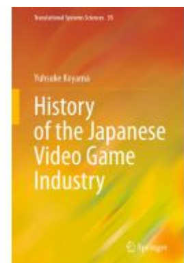
History of the Japanese Video Game Industry Ladenpreis: 164,99EUR