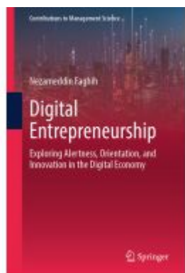
Digital Entrepreneurship Ladenpreis: 175,99EUR