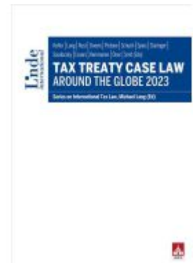
Tax Treaty Case Law around the Globe 2023 Ladenpreis: 95,00EUR