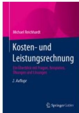
Kosten- und Leistungsrechnung Ladenpreis: 51,39EUR