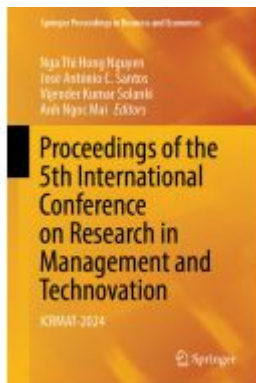
Proceedings of the 5th International Conference on Research in Management and Technovation Ladenpreis: 241,99EUR