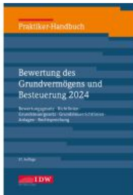
Praktiker-Handbuch Bewertung des Grundvermögens und Besteuerung 2024 Ladenpreis: 55,60EUR

Wir haben andere Produkte gefunden, die Ihnen gefallen könnten!