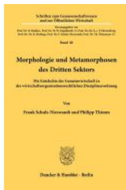
Morphologie und Metamorphosen des Dritten Sektors. Ladenpreis: 61,60EUR