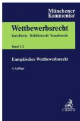
Münchener Kommentar zum Wettbewerbsrecht Bd. 1/2: Europäisches Wettbewerbsrecht. Kfz-GVO, FuE-GVO, Spezialisierungs-GVO, TT-GVO, FKVO, Internationale Fusionskontrolle, Verfahren vor den Europäischen Gerichten in Wettbewerbs- und Beihilfesachen