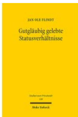
Gutgläubig gelebte Statusverhältnisse