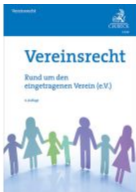
Vereinsrecht Ladenpreis: 10,20EUR

Wir haben andere Produkte gefunden, die Ihnen gefallen könnten!