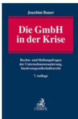
Die GmbH in der Krise Ladenpreis: 173,80EUR