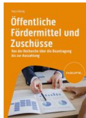
Öffentliche Fördermittel und Zuschüsse Ladenpreis: 56,60EUR