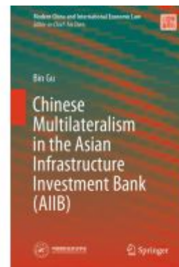
Chinese Multilateralism in the Asian Infrastructure Investment Bank (AIIB)