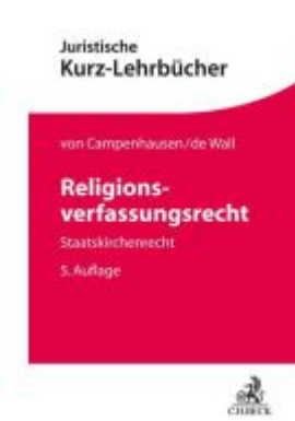
Religionsverfassungsrecht Ladenpreis: 41,00EUR