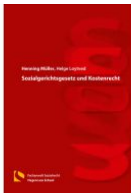
Sozialgerichtsgesetz und Kostenrecht Ladenpreis: 40,10EUR