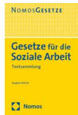
Gesetze für die Soziale Arbeit Ladenpreis: 30,80EUR