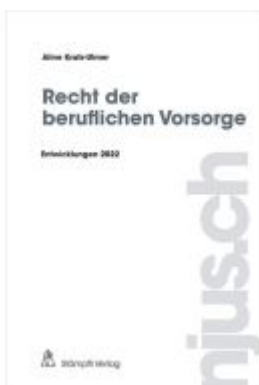
Recht der beruflichen Vorsorge Ladenpreis: 81,20EUR