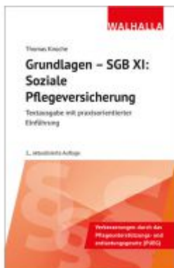
Grundlagen - SGB XI: Soziale Pflegeversicherung Ladenpreis: 15,40EUR