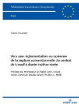
Vers une réglementation européenne de la rupture conventionnelle du contrat de travail à durée indéterminée Ladenpreis: 104,80EUR