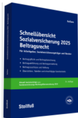
Schnellübersicht Sozialversicherung 2025 Beitragsrecht Ladenpreis: 104,90EUR