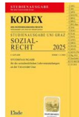
KODEX Studienausgabe Sozialrecht Graz 2025 Ladenpreis: 12,00EUR