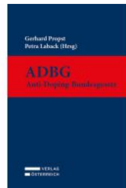
ADBG - Anti-Doping-Bundesgesetz Ladenpreis: 179,00EUR