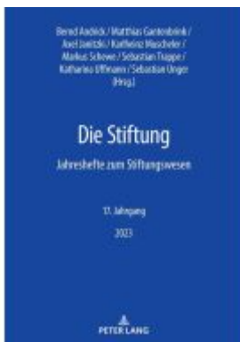
Die Stiftung Ladenpreis: 30,80EUR