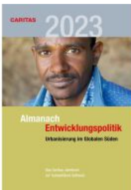
Urbanisierung im Globalen Süden Ladenpreis: 36,00EUR