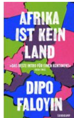
Afrika ist kein Land Ladenpreis: 14,40EUR