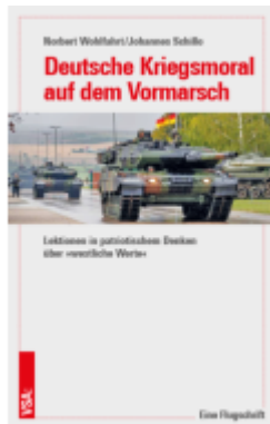
Deutsche Kriegsmoral auf dem Vormarsch Ladenpreis: 10,30EUR