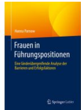
Frauen in Führungspositionen Ladenpreis: 46,25EUR