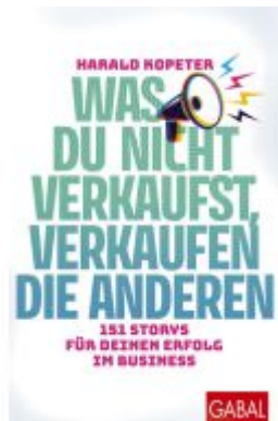
Was du nicht verkauft, verkaufen die anderen Ladenpreis: 28,80EUR