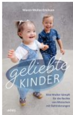
Geliebte Kinder Ladenpreis: 20,60EUR