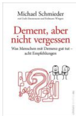
Dement, aber nicht vergessen Ladenpreis: 23,70EUR