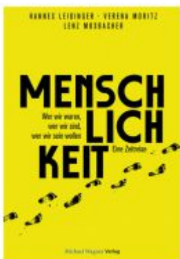
Menschlichkeit. Ladenpreis: 24,90EUR

Wir haben andere Produkte gefunden, die Ihnen gefallen könnten!