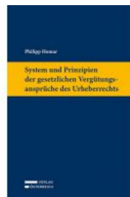
System und Prinzipien der gesetzlichen Vergütungsansprüche des Urheberrechts Ladenpreis: 129,00 EUR