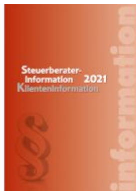
Steuerberater-Information 2021 Ladenpreis: 44,90 EUR