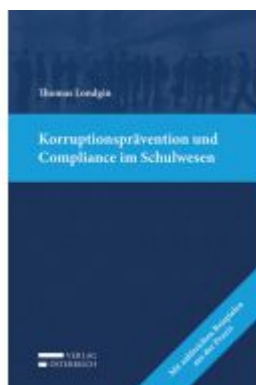
Korruptionsprävention und Compliance im Schulwesen Ladenpreis: 39,00 EUR