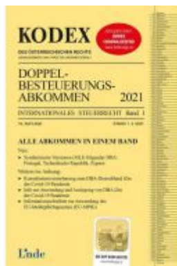
KODEX Doppelbesteuerungsabkommen 2021 Ladenpreis: 65,00 EUR