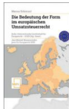
Die Bedeutung der Form im europäischen Umsatzsteuerrecht Ladenpreis: 58,00 EUR