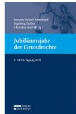
Jubiläumjahr der Grundrechte Ladenpreis: 49,00 EUR