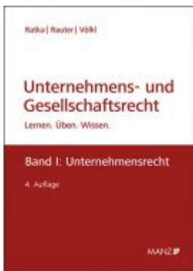
Unternehmens- und Gesellschaftsrecht Ladenpreis: 49,00 EUR