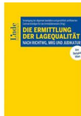
Die Ermittlung der Lagequalität nach RichtWG, MRG und Judikatur Ladenpreis: 39,00EUR