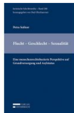
Flucht - Geschlecht - Sexualität Ladenpreis: 98,00EUR