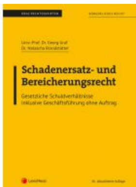
Bürgerliches Recht - Schadenersatz- und Bereicherungsrecht (Skriptum) Ladenpreis: 22,50EUR