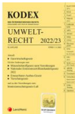
KODEX Umweltrecht 2022/23 - inkl. App Ladenpreis: 109,00EUR