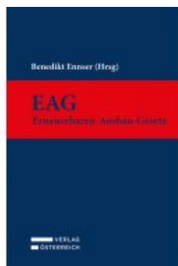
EAG - Erneuerbaren-Ausbau-Gesetz Ladenpreis: 89,00EUR