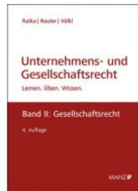
Unternehmens- und Gesellschaftsrecht Ladenpreis: 63,00EUR