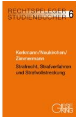
Strafrecht, Strafverfahren und Strafvollstreckung Ladenpreis: 50,40EUR