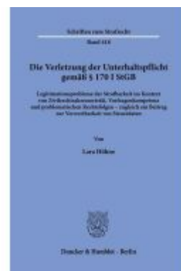
Die Verletzung der Unterhaltspflicht gemäß § 170 I StGB. Ladenpreis: 71,90EUR