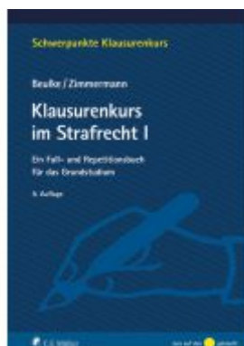
Klausurenkurs im Strafrecht I Ladenpreis: 25,70EUR