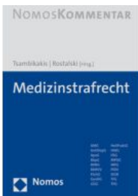
Medizinstrafrecht Ladenpreis: 153,20EUR