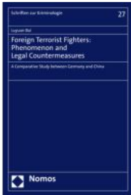
Foreign Terrorist Fighters: Phenomenon and Legal Countermeasures Ladenpreis: 96,70EUR