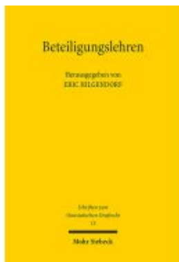
Beteiligungslehren Ladenpreis: 91,50EUR

Wir haben andere Produkte gefunden, die Ihnen gefallen könnten!