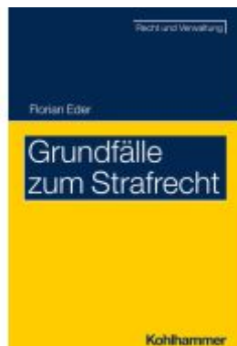
Grundfälle zum Strafrecht Ladenpreis: 22,70EUR