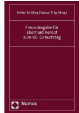
Freundesgabe für Eberhard Kempf zum 80. Geburtstag Ladenpreis: 71,00EUR