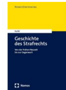
Geschichte des Strafrechts Ladenpreis: 30,80EUR