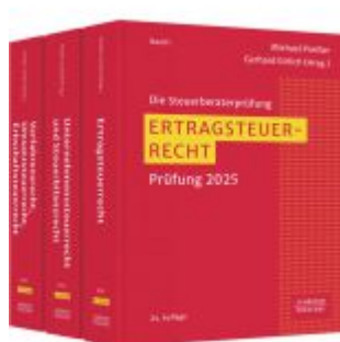
Die Steuerberaterprüfung Ladenpreis: 410,20EUR