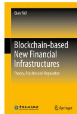
Blockchain-based New Financial Infrastructures Ladenpreis: 109,99EUR