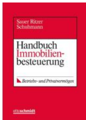
Handbuch Immobilienbesteuerung Ladenpreis: 101,80EUR