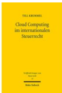
Cloud Computing im internationalen Steuerrecht Ladenpreis: 91,50EUR