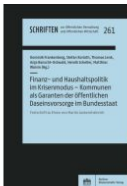
Finanz- und Haushaltspolitik im Krisenmodus – Kommunen als Garanten der öffentlichen Daseinsvorsorge im Bundesstaat Ladenpreis: 76,10EUR