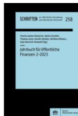
Jahrbuch für öffentliche Finanzen (2023) 2 Ladenpreis: 48,40EUR