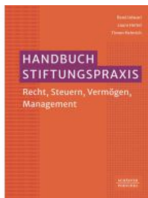
Handbuch Stiftungspraxis Ladenpreis: 92,60EUR