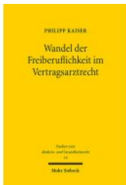
Wandel der Freiberuflichkeit im Vertragsarztrecht Ladenpreis: 91,50EUR

Wir haben andere Produkte gefunden, die Ihnen gefallen könnten!