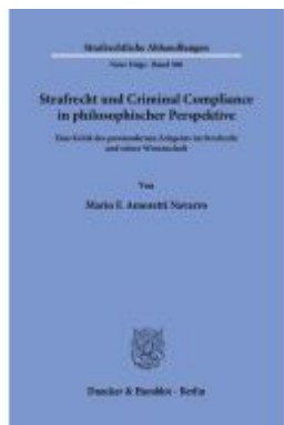
Strafrecht und Criminal Compliance in philosophischer Perspektive. Ladenpreis: 154,10EUR