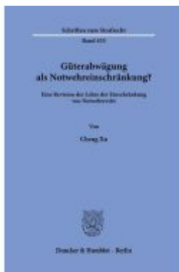
Güterabwägung als Notwehreinschränkung? Ladenpreis: 102,70EUR