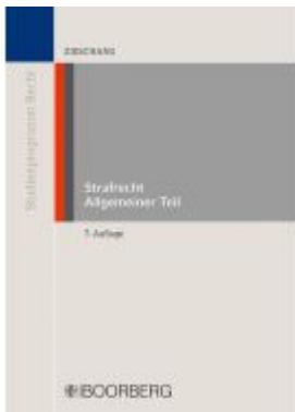
Strafrecht Allgemeiner Teil Ladenpreis: 26,70EUR

Wir haben andere Produkte gefunden, die Ihnen gefallen könnten!