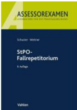
StPO-Fallrepetitorium Ladenpreis: 27,70EUR