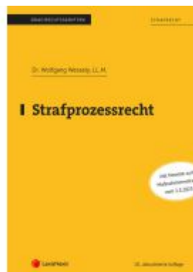
Strafprozessrecht (Skriptum) Ladenpreis: 25,00EUR