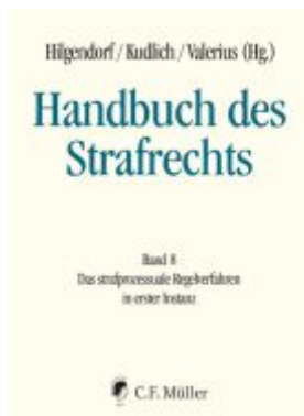
Handbuch des Strafrechts Ladenpreis: 308,50EUR