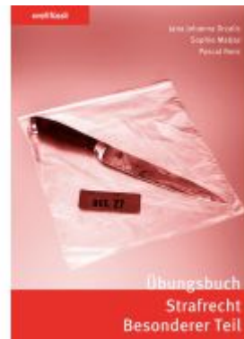
Orell Füssli Übungsbücher / Übungsbuch Strafrecht Besonderer Teil Ladenpreis: 39,10EUR