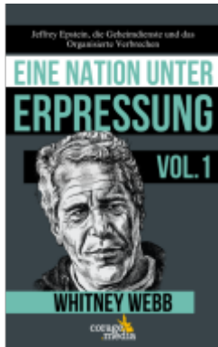
Eine Nation unter Erpressung - Blackmail Ladenpreis: 29,50EUR