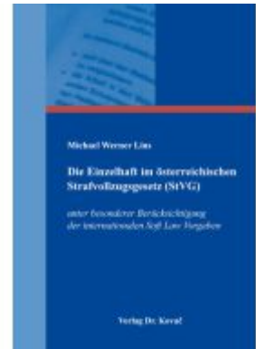
Die Einzelhaft im österreichischen Strafvollzugsgesetz (StVG) Ladenpreis: 60,50EUR