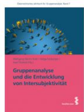
Gruppenanalyse und die Entwicklung von Intersubjektivität Ladenpreis: 19,90 EUR