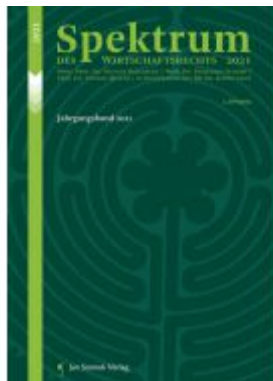
Spektrum des Wirtschaftsrechts Ladenpreis: 78,00 EUR