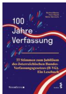
100 Jahre Verfassung