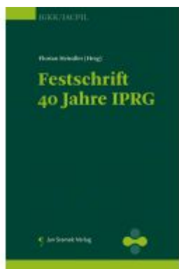
Festschrift 40 Jahre IPRG