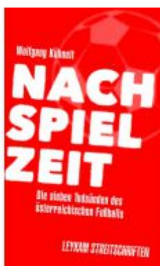
Nachspielzeit – Die sieben Todsünden des österreichischen Fußballs Ladenpreis: 7,50 EUR