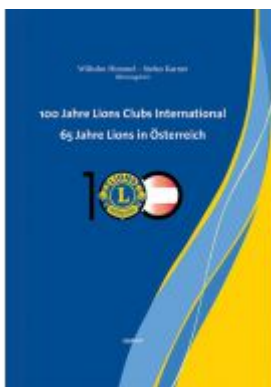
100 Jahre Lions Clubs International. 65 Jahre Lions in Österreich Ladenpreis: 29,90 EUR