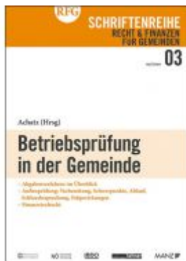
Betriebsprüfung in der Gemeinde