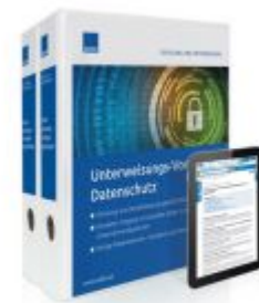
Unterweisungs-Vorlagen Datenschutz Ladenpreis: 217,80 EUR