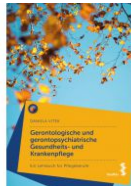
Gerontologische und gerontopsychiatrische Gesundheits- und Krankenpflege Ladenpreis: 9,90 EUR