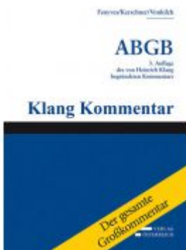
Großkommentar zum ABGB - Klang Kommentar Ladenpreis: 5.166,00 EUR