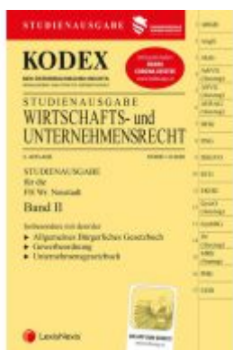
KODEX Wirtschafts- und Unternehmensrecht 2020 Band II Ladenpreis: 22,50 EUR