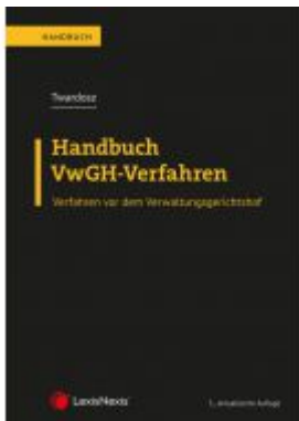
Handbuch VwGH-Verfahren Ladenpreis: 69,00 EUR

Wir haben andere Produkte gefunden, die Ihnen gefallen könnten!