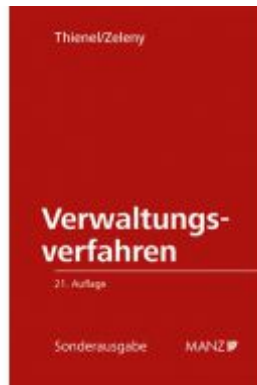
Verwaltungsverfahren Ladenpreis: 98,00 EUR