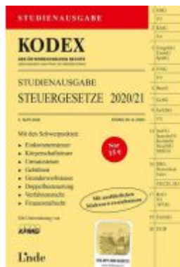
KODEX Studienausgabe Steuergesetze 2020/21

Wir haben andere Produkte gefunden, die Ihnen gefallen könnten!