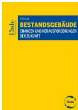
Bestandsgebäude Ladenpreis: 89,00 EUR