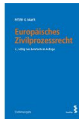
Europäisches Zivilprozessrecht Ladenpreis: 46,00 EUR