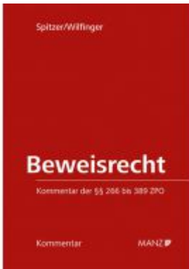
Beweisrecht Ladenpreis: 74,00 EUR