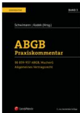
ABGB Praxiskommentar / ABGB Praxiskommentar - Band 5, 5. Auflage Ladenpreis: 289,00 EUR