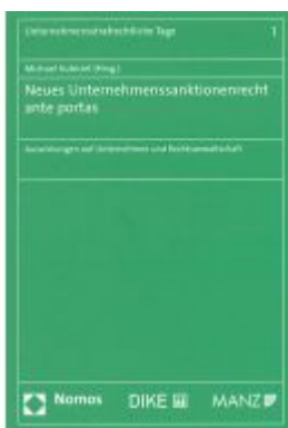
Neues Unternehmenssanktionenrecht ante portas Ladenpreis: 49,00 EUR