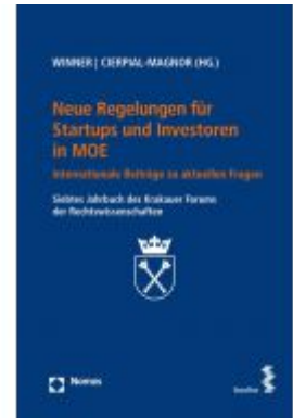
Neue Regelungen für Startups und Investoren in MOE Ladenpreis: 38,00 EUR