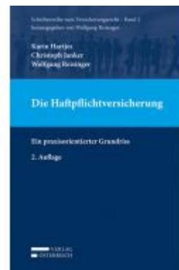
Die Haftpflichtversicherung Ladenpreis: 69,00 EUR