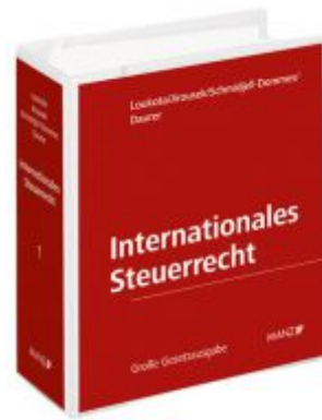
Internationales Steuerrecht Ladenpreis: 498,00 EUR