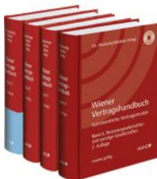
PAKET: Wiener Vertragshandbuch Ladenpreis: 678,00 EUR