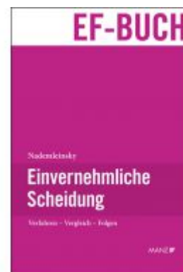
Einvernehmliche Scheidung Ladenpreis: 69,00 EUR