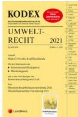
KODEX Umweltrecht 2021 Ladenpreis: 105,00 EUR