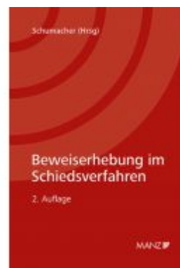
Beweiserhebung im Schiedsverfahren Ladenpreis: 105,00 EUR