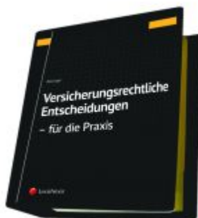
Versicherungsrechtliche Entscheidungen - aufbereitet für die Praxis Ladenpreis: 329,00 EUR