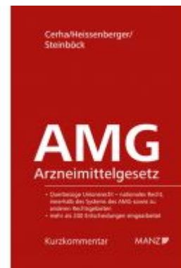
Arzneimittelgesetz AMG Ladenpreis: 128,00 EUR