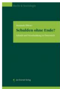
Schulden ohne Ende? Ladenpreis: 85,00 EUR