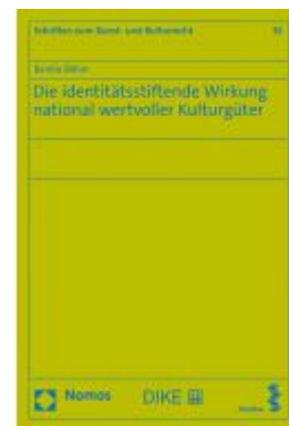
Die identitätsstiftende Wirkung national wertvoller Kulturgüter Ladenpreis: 55,60 EUR