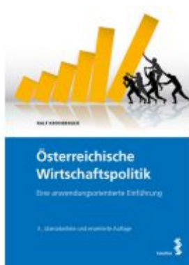
Österreichische Wirtschaftspolitik Ladenpreis: 38,00 EUR