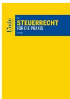
Steuerrecht für die Praxis Ladenpreis: 70,00 EUR