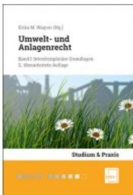
Umwelt- und Anlagenrecht Ladenpreis: 68,00 EUR