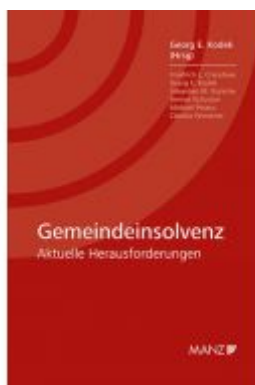
Gemeindeinsolvenz Ladenpreis: 54,00 EUR