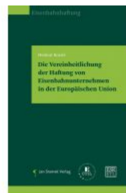
Die Vereinheitlichung der Haftung von Eisenbahnunternehmen in der Europäischen Union Ladenpreis: 59,90 EUR