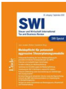
SWI-Spezial Meldepflicht für potenziell aggressive Steuerplanungsmodelle Ladenpreis: 58,00 EUR

Wir haben andere Produkte gefunden, die Ihnen gefallen könnten!