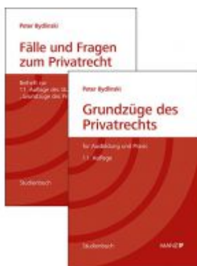
PAKET: Grundzüge des Privatrechts + Fälle und Fragen zum Privatrecht 11. Auflage Ladenpreis: 64,00 EUR