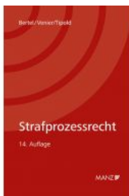
Strafprozessrecht Ladenpreis: 38,00 EUR