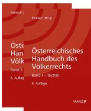
Österreichisches Handbuch des Völkerrechts Ladenpreis: 149,00 EUR