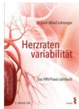
Herzratenvariabilität Ladenpreis: 46,90 EUR