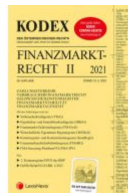
KODEX Finanzmarktrecht Band II 2021 Ladenpreis: 81,00 EUR