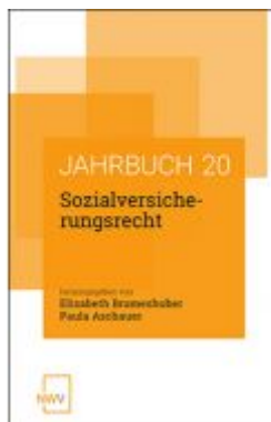
Sozialversicherungsrecht Ladenpreis: 62,00 EUR