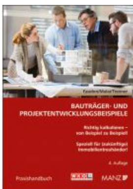
Bauträger- und Projektentwicklungsbeispiele Ladenpreis: 46,00 EUR