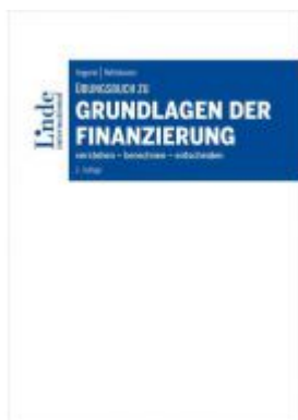
Übungsbuch zu Grundlagen der Finanzierung