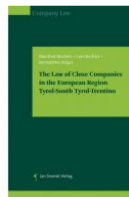
The Law of Close Companies in the European Region Tyrol-South Tyrol-Trentino