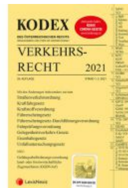
KODEX Verkehrsrecht 2021 Ladenpreis: 92,00 EUR