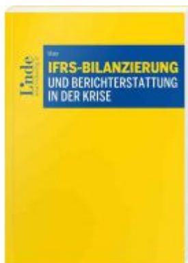
IFRS-Bilanzierung und Berichterstattung in der Krise