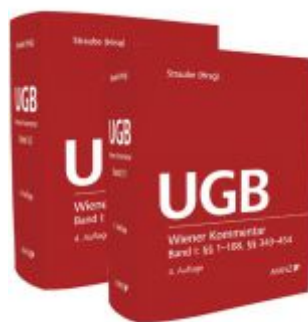
Wiener Kommentar zum UGB PAKET Band 1 + Band 2