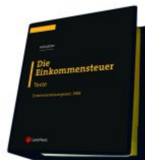
Die Einkommensteuer (EStG 1988) Band I - Texte Ladenpreis: 298,00 EUR