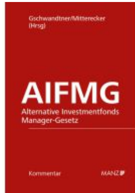
Alternative Investmentfonds Manager- Gesetz AIFMG Ladenpreis: 298,00EUR