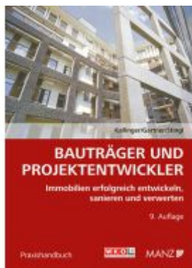
Bauträger und Projektentwickler Ladenpreis: 56,00EUR