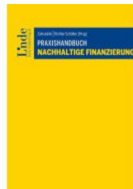
Praxishandbuch Nachhaltige Finanzierung Ladenpreis: 66,00EUR