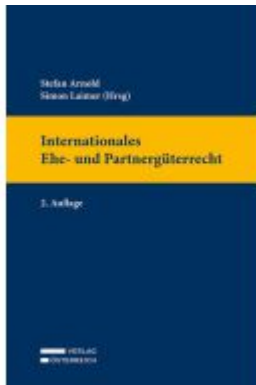
Internationales Ehe- und Partnergüterrecht Ladenpreis: 139,00EUR