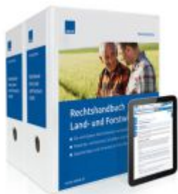
Rechtshandbuch Land- und Forstwirtschaft Ladenpreis: 239,80EUR

Wir haben andere Produkte gefunden, die Ihnen gefallen könnten!