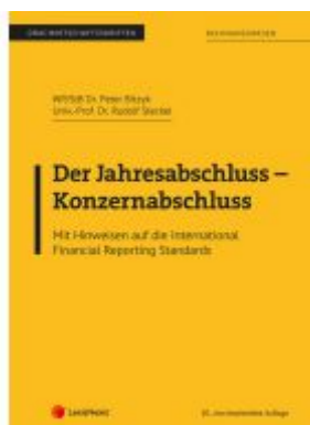
Der Jahresabschluss - Konzernabschluss Ladenpreis: 23,75EUR