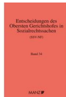
Entscheidungen des obersten Gerichtshofes in Sozialrechtssachen SSV- NF Ladenpreis: 322,00EUR