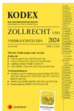
KODEX Zollrecht 2024 - inkl. App Ladenpreis: 119,00EUR