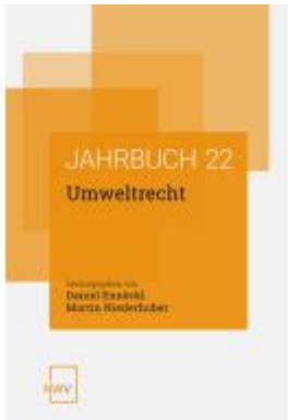
Umweltrecht Ladenpreis: 68,00EUR