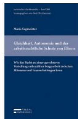
Gleichheit, Autonomie und der arbeitsrechtliche Schutz von Eltern