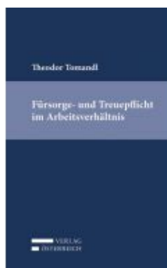
Fürsorge- und Treuepflicht im Arbeitsverhältnis