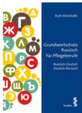
Grundwortschatz Russisch für Pflegeberufe Ladenpreis: 18,90 EUR