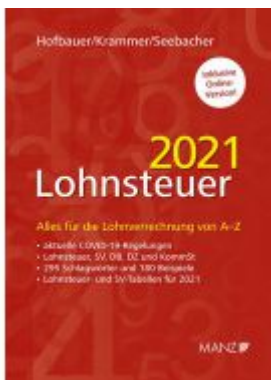
Lohnsteuer 2021 Ladenpreis: 59,00 EUR

Wir haben andere Produkte gefunden, die Ihnen gefallen könnten!