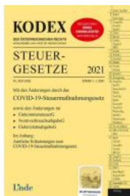
KODEX Steuergesetze 2021 Ladenpreis: 39,00 EUR