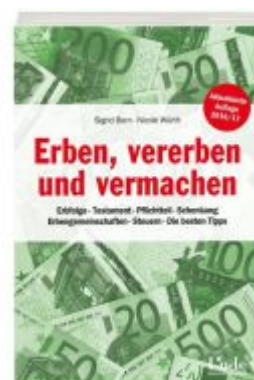
Erben, vererben und vermachen Ladenpreis: 12,90 EUR