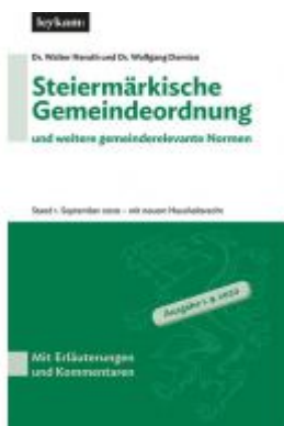
Steiermärkische Gemeindeordnung und weitere gemeinderelevante Normen