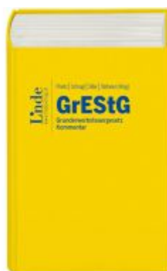
GrESTG Kommentar Ladenpreis: 240,00 EUR