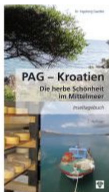
PAG - Kroatien Ladenpreis: 11,99 EUR