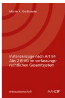
Instanzenzüge nach Art 94 Abs 2 B-VG im verfassungsrechtlichen Gesamtsystem Ladenpreis: 58,00EUR