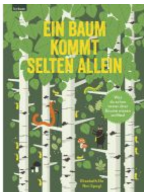
Ein Baum kommt selten allein Ladenpreis: 24,50EUR