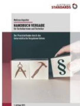
Handbuch Vergabe für Technikerinnen und Techniker Ladenpreis: 64,90EUR