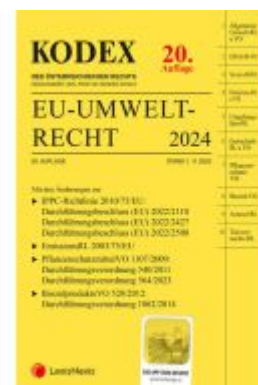
KODEX EU-Umweltrecht 2023/24 - inkl. App Ladenpreis: 108,00EUR