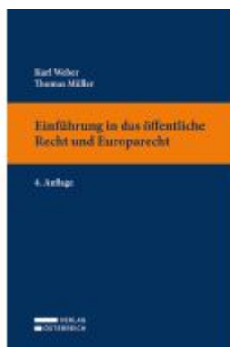
Einführung in das öffentliche Recht und Europarecht Ladenpreis: 24,00EUR