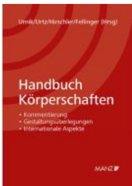
Handbuch Körperschaften Ladenpreis: 148,00EUR

Wir haben andere Produkte gefunden, die Ihnen gefallen könnten!