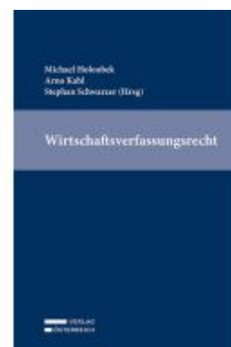
Wirtschaftsverfassungsrecht Ladenpreis: 169,00EUR