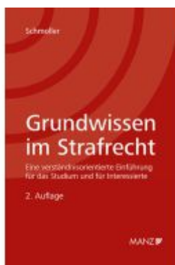
Grundwissen im Strafrecht Ladenpreis: 38,00EUR