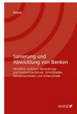
Sanierung und Abwicklung von Banken Ladenpreis: 78,00EUR