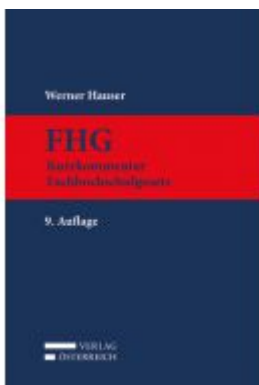
FHG Kurzkommentar Fachhochschulgesetz