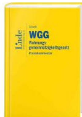
WGG I Wohnungsgemeinnützigkeitsgesetz Ladenpreis: 79,00 EUR