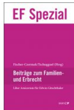
Liber Amicorum Edwin Gitschthaler