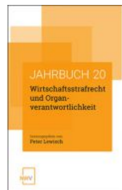
Wirtschaftsstrafrecht und Organverantwortlichkeit Ladenpreis: 58,00 EUR