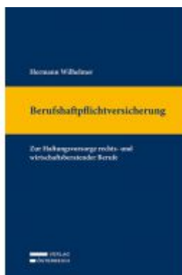
Berufshaftpflichtversicherung Ladenpreis: 255,00 EUR