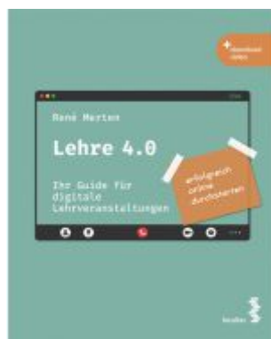
Lehre 4.0 Ladenpreis: 21,90EUR