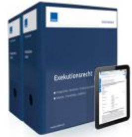
Exekutionsrecht Ladenpreis: 261,80EUR