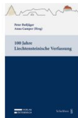
100 Jahre Liechtensteinische Verfassung Ladenpreis: 49,00EUR