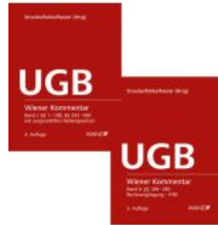
Wiener Kommentar zum UGB PAKET Band 1 + Band 2 Ladenpreis: 578,00EUR