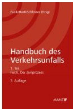
Handbuch des Verkehrsunfalls Zivilprozessrecht Ladenpreis: 54,00EUR

Wir haben andere Produkte gefunden, die Ihnen gefallen könnten!