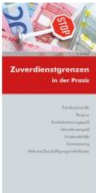
Zuverdienstgrenzen in der Praxis Ladenpreis: 13,20EUR