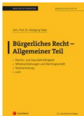
Bürgerliches Recht - Allgemeiner Teil (Skriptum) Ladenpreis: 26,25EUR