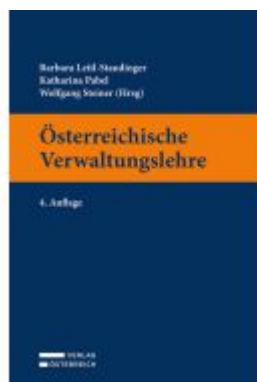
Österreichische Verwaltungslehre Ladenpreis: 49,00EUR