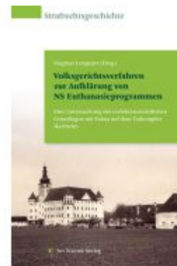
Volksgerichtsverfahren zur Aufklärung von NS Euthanasieprogrammen Ladenpreis: 59,90EUR