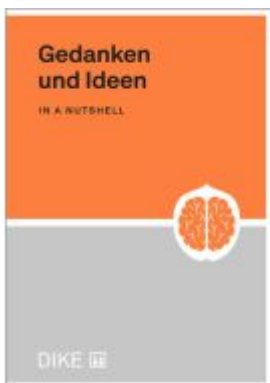
Gedanken und Ideen in a nutshell Ladenpreis: 9,00EUR