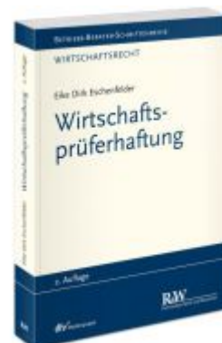
Wirtschaftsprüferhaftung Ladenpreis: 91,50EUR