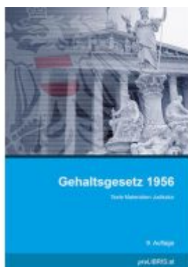
Gehaltsgesetz 1956 Ladenpreis: 41,00EUR