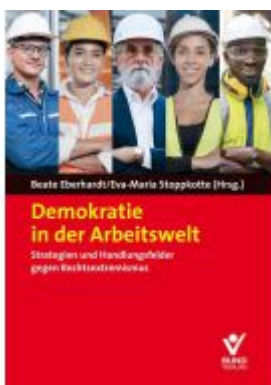
Demokratie in der Arbeitswelt Ladenpreis: 22,70EUR