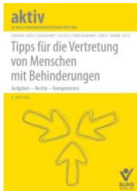
Tipps für die Vertretung von Menschen mit Behinderungen Ladenpreis: 30,70EUR