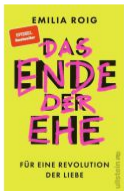
Das Ende der Ehe Ladenpreis: 23,70EUR