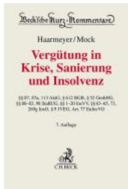
Vergütung in Krise, Sanierung und Insolvenz Ladenpreis: 132,70EUR

Wir haben andere Produkte gefunden, die Ihnen gefallen könnten!