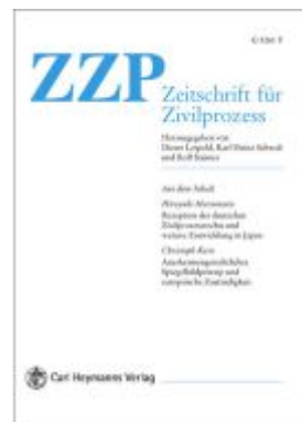
Zeitschrift für Zivilprozess International. ZZP Int. Jahrbuch des... / Zeitschrift für Zivilprozess International. Ladenpreis: 150,10EUR