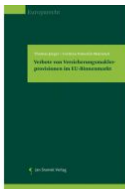
Verbote von Versicherungsmaklerprovisionen im EU- Binnenmarkt Ladenpreis: 49,90EUR