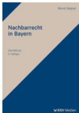
Nachbarrecht in Bayern Ladenpreis: 29,90EUR