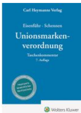
Unionsmarkenverordnung Ladenpreis: 266,30EUR