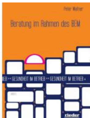
Beratung im Rahmen des BEM Ladenpreis: 19,10EUR