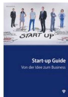
Start-up Guide Ladenpreis: 33,00EUR