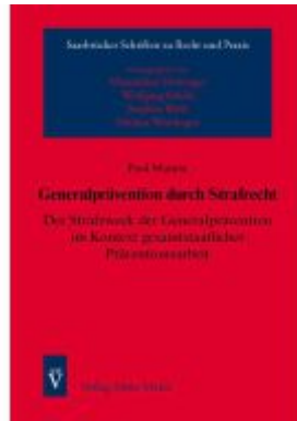
Generalprävention durch Strafrecht Ladenpreis: 49,40EUR