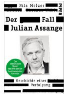
Der Fall Julian Assange Ladenpreis: 14,40EUR