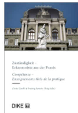
Zuständigkeit - Erkenntnisse aus der Praxis Ladenpreis: 86,00EUR