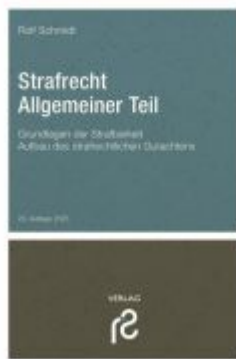
Strafrecht Allgemeiner Teil Ladenpreis: 27,60EUR